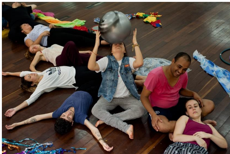
Oficina “Dança, Teatro e Autismo” na UNIRIO – Rio de Janeiro, 07 de dezembro de 2018.