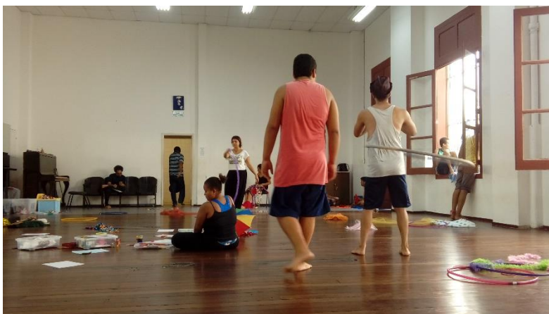
Oficina de Teatro Circulando – setembro, 2018.

Na Escola de Teatro da UNIRIO, bem como em outras escolas e universidades atualmente, os Projetos de Extensão se apresentam como importante dispositivo para a formação integral dos estudantes como acadêmicos, pesquisadores, professores e ainda como cidadãos pertencentes a uma sociedade.