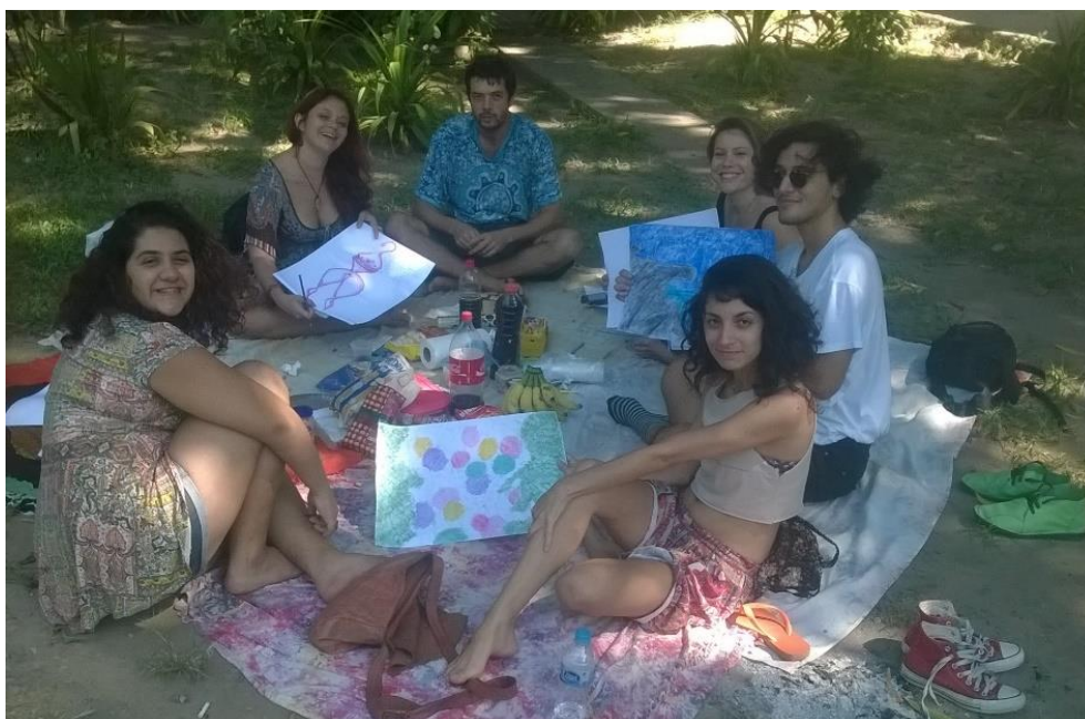
Oficineiros no I Encontro Circulando com o Autismo – 2016

É nesse período também que o projeto passa a realizar seu evento anual, nomeado Encontro Circulando com o Autismo , que vem desde 2016, trazendo visibilidade para o Projeto Circulando e fomentando discussão sobre autismos, arte, saúde mental e educação inclusiva dentro da universidade e na formação dos professores, gerando troca de informação, formação e prática em todos esses campos.