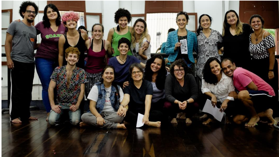
Equipe e alguns participantes do III Encontro Circulando com o Autismo – Dezembro de 2018.