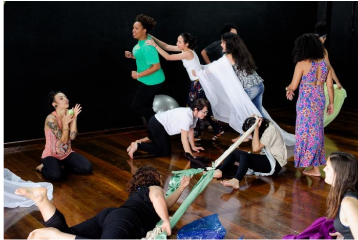
Oficina “Dança, Teatro e Autismo” na UFMG – Belo Horizonte, 14 de setembro de 2018.